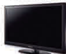
TV LED Samsung 40" Para aportaciones de más de 75.000 €

HAZ TU APORTACIÓN, ELIGE UN REGALO Y DISFRUTA DE VENTAJAS FISCALES