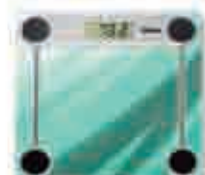
Báscula de baño electrónica digital Para aportaciones de 3.001 € a 5.000 €