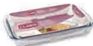
Bandeja de horno 36,6 X 20,7 X 5,2 cm Para aportaciones de 1.000 € a 3.000 €