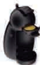
Cafetera Dolce Gusto Piccolo Para aportaciones de 5.001 € a 30.000 €