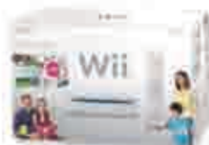
Consola Wii + Wii Party + Wii Sports Resort Para aportaciones de 30.001 € a 75.000 €